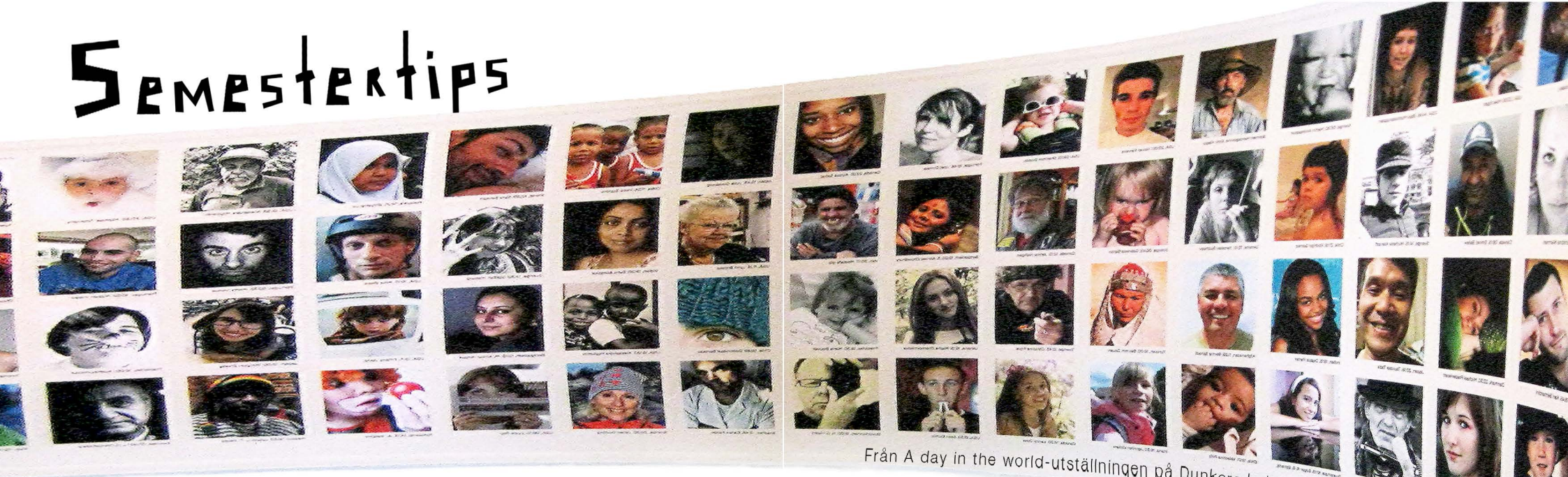
Från A day in the world-utställningen på Dunkers kulturhus

Nu är det sommar och folk åker på semester både inom Sverige och utomlands. Men det är inte alla som har möjlighet till detta av en eller annan anledning, kanske vill man stanna hemma på semestern. Man behöver inte sakna något att göra för det, det finns också en hel del aktiviteter att göra i här i Helsingborg och i närområdet. Man kan ha en minst lika bra sommar här omkring. Därför har vi här valt ut några aktiviteter och platser som är trevliga för både gamla och unga. En del kanske du känner till, andra inte. Du som är helsingborgare, hur många av dessa ställen har du varit på?