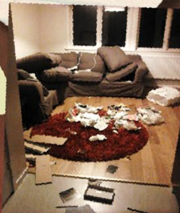
Julafton på behandlingshemmet.